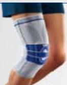
GenuTrain® A3 Spezialpelotte für komplexe Schmerztherapie